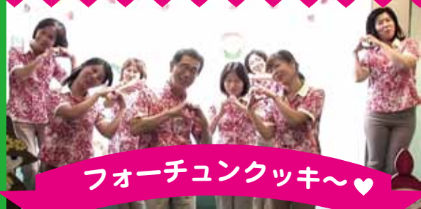
フォーチュンクッキー～♡