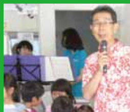
開院して 20年たったので