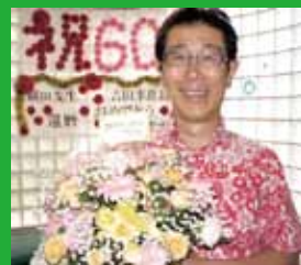
じいじになり (麗実先生家族と)